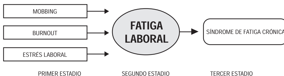
Figura 2. HIPÓTESIS DE LA CADENA DE ESTRÉS